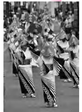
北前船が運んだ文化「大正寺おけさ」。祭りは毎年8月第3日曜開催

さらには、寄港地から舟運を介して河川を遡上し内陸部へと伝わっていることにも興味を覚えます。雄和地域の大正寺おけさは、