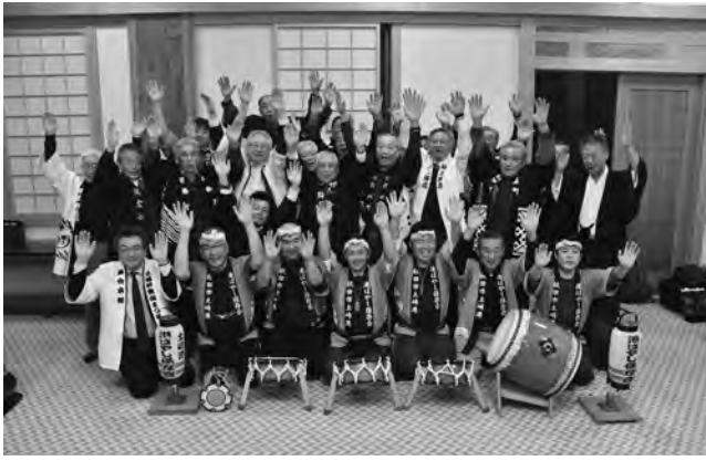
「土崎神明社祭の曳山行事」のユネスコ無形文化遺産登録の一報を受けて喜ぶ関係者のみなさん(昨年12月)