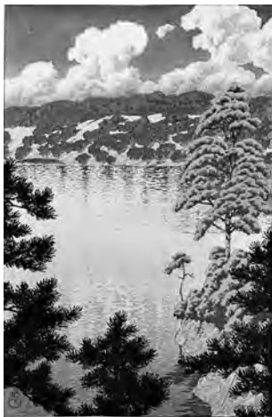
川瀬巴水「秋田空集沼」(昭和2年)