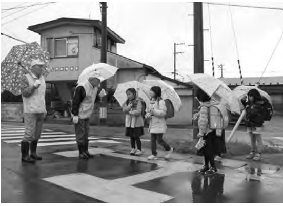
見守り隊のみなさんが、雨の日も風の日も、子どもたちの安全安心をサポートしてくれています (写真は日新小学区)

お はよう!「お帰り!」。小学校周辺の通学路から、今日も元気なあいさつが聞こえてきます。児童の安全な登下校をサポートしているのは地域の「見守り隊」。「パトロール隊」のみならず、各地区で規模や形態は異なります。