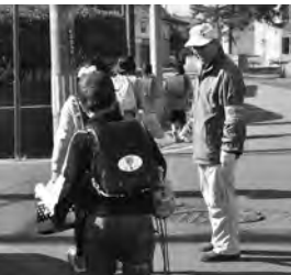
声をかけて見送り

平成18年の発足になりますが、この地区も隊員の高齢化と活動できる人の固定化が進んでいます。それぞれが負担にならないよう、できる範囲で見守るようにしています。新たな「地域の目」が増えてくれるとうれしいです。