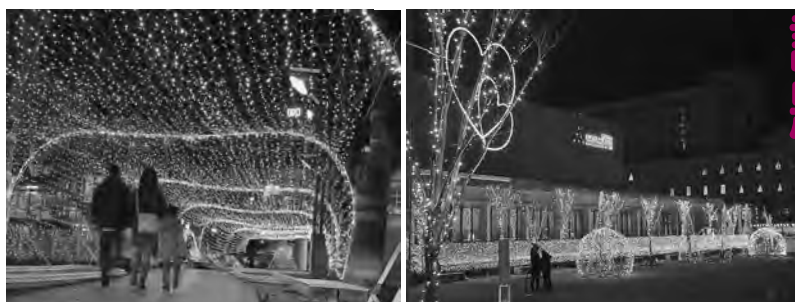
赤や黄色に紫と、たくさんの灯りが、まち行く人を照らします。「インスタ映え」まちがいなし！ぜひお出かけください！

地域芸術祭のあり方を通して「まちの将来の姿」を考えることや、アーティストが、地域の特性や課題と出会うことで、「場所」が持つ力を引き出し、新たな価値を生み出す可能性があると聞いたゲストからの多様なメッセージに、聴講したみなさんはそれぞれに、地域芸術祭のあるべき姿を思い描いている様子でした。