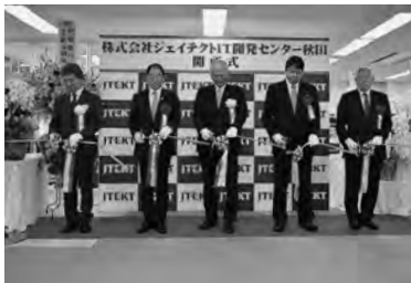
11月24日の開所式でのテープカットの様子。

同社は、トヨタ自動車グループの主要企業である(株)ジェイテクトが、電動パワーステアリングシステムなどの自動車部品などに組み込むソフトウェアの開発を行うために設立した企業で、自動運転技術の将来を見据え、今後、その開発拠点となることが期待されています。また、開所にあたり「Aターソン」就職者14人を含む16人を採用し、今後、県内の大学などとの連携を図り、地元採用にも力を入れていくこととしています。 市では、地域産業の振興と雇用の拡大をさらに促進するため、引き続き企業の誘致活動に努めてまいります。