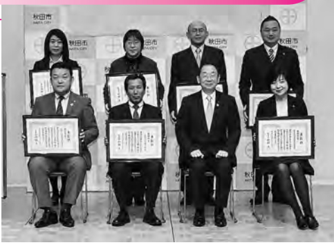
表彰を受けた企業のみなさん