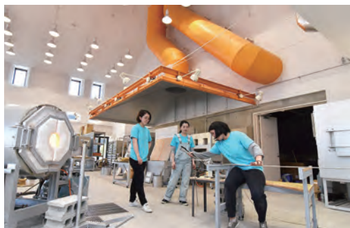
7月15日、新屋ガラス工房がオープン。「ものづくり、ひとづくり、まちづくりの創造拠点」となることをめざします