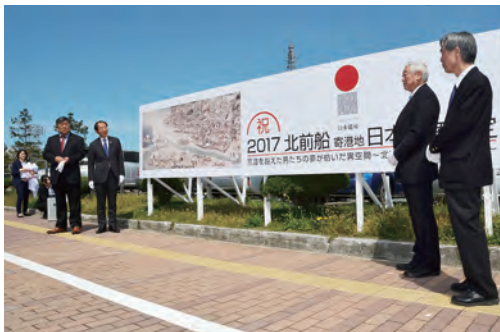
5月1日、「北前船寄港地・船主集落」の日本遺産認定祝賀看板の除幕式で。北前船に縁ある全国11市町が申請しました