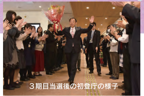
3期目当選後の初登庁の様子