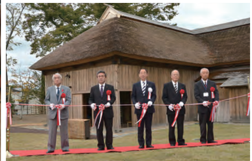
復元整備工事を終えた、「国指定名勝旧秋田藩主佐竹氏別邸(如斯亭)庭園」が、10月21日に開園しました