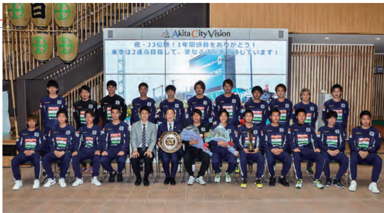
サッカー・ブラウブリッツ秋田が、J3念願の初優勝！ 安定したチーム力、そして何よりサポーターの力があってこそ！ みんなで勝ち取った優勝です！（写真は12月14日、市長への報告会で）