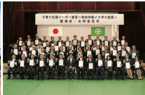
2月10日、市職員幹部による「子育て応援リーダー宣言～秋田市版イクボス宣言」の合同宣言式を行いました