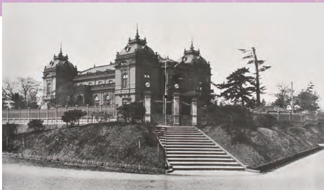
秋田県公会堂

県・市連携文化施設の建設予定地である県民会館の敷地には、かつて、重厚、壮麗な文化の殿堂・秋田県公会堂があり、その南側に隣接するように、東京駅の設計で有名な建築家・辰野金吾による秋田県記念館の建設が進められていました。美しいルネッサンス様式の洋風建築が2つ並ぶはずでしたが、大正7年4月、公会堂は失火により惜しくも焼失。わずか半年後の10月に竣工した記念館との共演は実現しませんでした。今からちょうど100年前の出来事です。