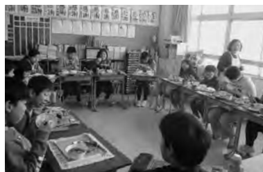
ごちそうさまでした！

の牛肉を調理した「すきやき」が給食のメニューに出され、子どもたちは市内産の安全安心なお肉を生産者に感謝の気持ちを込めていただけていました。