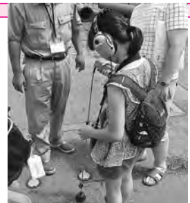
漏水探知体験の様子

川の水がどのように飲み水になり、使った水をどのようにきれいにするかを、親子で一緒に学びます。