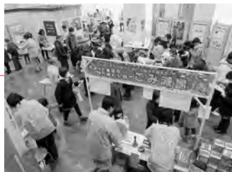
ごみ減量アクション

施設の実施設計を進めるとともに、運営管理計画を策定するほか、建物の移転補償などを行います …12億4千488万円