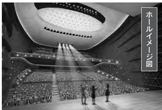
ホールイメージ図

地下1階、地上6階で、約2千席の高機能型ホールと約8百席の舞台芸術型ホールを備えています。完成は3年後の予定