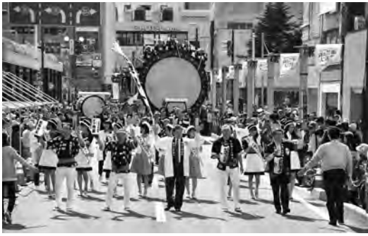
東北六魂祭の思いを受け継ぐ「食と芸能大祭典」を今年も開催！詳しくは今号の12ページをご覧ください