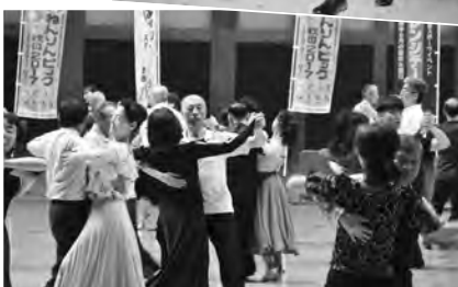
社交ダンスで華麗なステップ