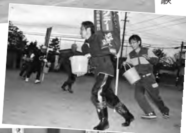
地域のみんなでバケツリレー