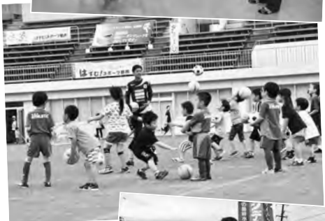
ちびっこサッカー体験