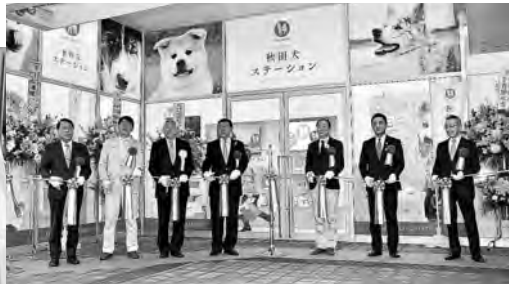
施設前でのテープカット