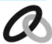
新しいシンボルマーク

市内企業で働くみなさんの福利厚生の実を目的に昭和53年から活動してきた秋田市勤労者共済会。このたび、名称を「秋田市勤労者福祉サービスセンター」に変更し、シンボルマークも新しくしました。センターに、親しみやすく働く人にわかりやすい愛称をつけてください。