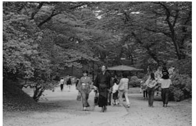
色鮮やかなツツジの大合唱(千秋公園)