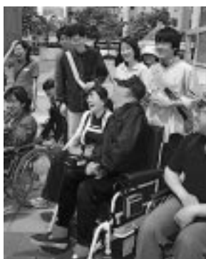
青空のもと、学生たちの車いす体験学習(アゴラ広場)

若葉が揺れる五月。 千秋公園から秋田駅前まで、いきいきとした緑に沿って歩いてみると、お気に入りの場所で、思い思いの時間を過ごしている人たちの、いろんな顔がありました。 中央街区と呼ばれるこの場所は、今、再開発に向けての準備が着々と進められています。やっぱりここは人が行き交い、集う場所…。公園で遊ぶ親子、おしゃべりに花を咲かせる若者やお年寄り、ギターを手に歌に思いを込めるストリートミュージシャン。人のにぎわいが街を元気にさせます。 心地よい風を感じながら、公園や駅前をブラブラ歩いてみませんか。