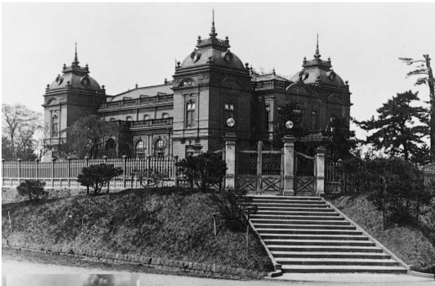
文化の香り高く、威風堂々としたたずまいの秋田県公会堂