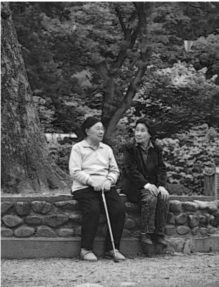
木陰でちょっとおしゃべり(千秋公園)