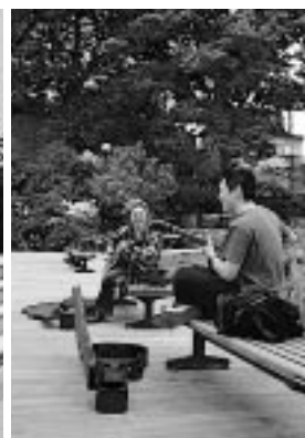
僕らの曲さ (千秋公園ポケットパーク)