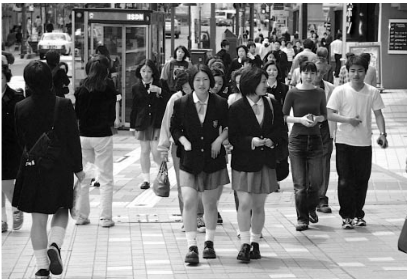
土曜日の昼下がり。行き交う人々のにぎわいに、街の大きな息づかいが感じられます(秋田フォーラス前)