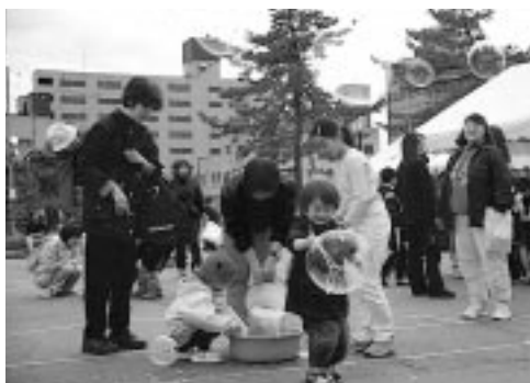
日赤・婦人会館跡地でチルドレンズ・ミュージアム