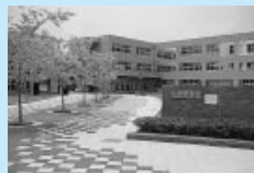
中高一貫校の御所野学院

定員は両日とも20人。定員を超えた場合は抽選となります。当日の昼食は持参するか、途中の中央地区老人福祉総合エリアの食堂をご利用ください。参加無料。