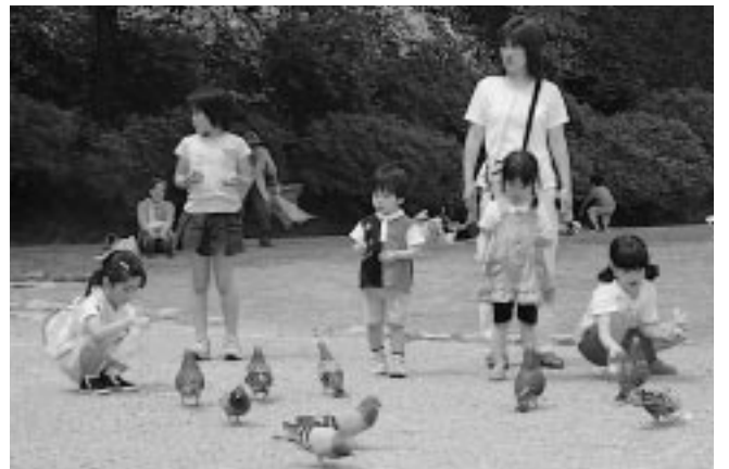
「ハトさんこっち」。可愛らしい声が響きます(千秋公園)