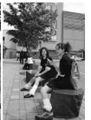
待ち合わせ♪(秋田駅前)