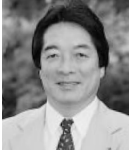
市長 石川 錬治郎

市政への建設的なご意見、ご提言を電話でお聴きする 今月の市長ホットラインは、都合によりお休みします。 ご了承ください。 市民相談室☎(866)2039