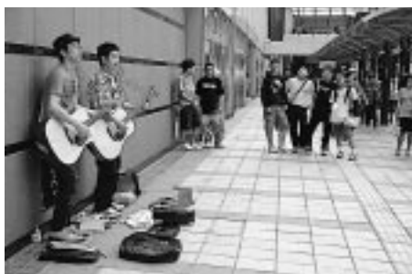
みんな聴いて(秋田駅前)