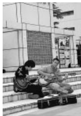
思いを込めて(アゴラ広場)