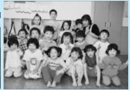
北保育園で(下新城中野)