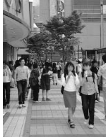
今日は駅前でショッピング