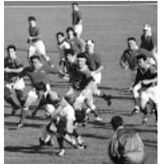
市役所ラグビー部

「官界」という雑誌に「世界最強の公務員ラグビーチーム」と題して寄稿。勿論我市のラグビーチームのこと。数年前にもNHK教育テレビで同名のタイトルで放映され話題を呼ぶ。ラグビーだけでなく、市役所のサッカー、野球、卓球、バスケ、フエッティング、そして相撲部まであることを紹介し、その種目の多様性とレベルの高さを自慢。