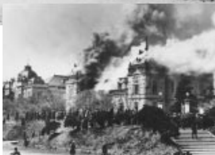
公会堂炎上、左は記念館