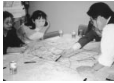
中央地域まちづくり懇談会

懇談会で出された主な意見 ・まちの活力となる若者にとって魅力があり、また高齢者に優しいまちづくりを望みたい。 ・車を減らす発想のまちづくり、歩行者空間を優先した多少歩いてでも行きたくなるまちづくりが必要ではないか。 ・中心部は開発の際、住宅を盛り込んだ方針とするなど、人口を呼び戻すために住宅供給が必要。 ・千秋公園とつながりある周辺開発を望む。特に緑をいかした整備を中心部では行ってほしい。