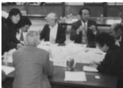
北部地域まちづくり懇談会