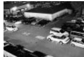
夜の市役所駐車場

市役所駐車場は、夜間と休日には一般開放していません。ところが、満車になると通路や出入口付近に駐車したり、翌朝まで駐車したりする、迷惑駐車や後を絶ちません。緊急車両の出入りの支障になったり、事故にもつなが