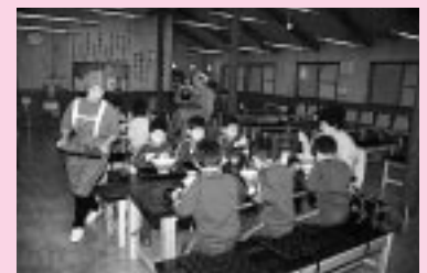
上新城幼稚園の園児も「おいしい」

上新城にある知的障害者の入所授産施設「おまたの里」では、地域交流ホーム「ほっと」をオープンしました。日本自転車振興会の補助を受けて建設したものです。