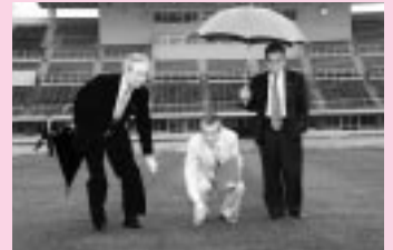
八橋陸上競技場を視察する JAWOCの役員

日本と韓国が共同で開催する「2002年サッカーワールドカップ大会」。このほど秋田市が、出場国の練習場となる公認キャンプ候補地に認定されました。