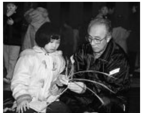
ワラをこんなにきれいに、すごいな、すごいな!