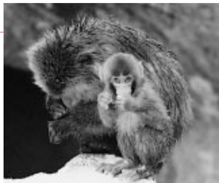
寒くても一生懸命暮らしてるよ

閉園中の冬の動物園をのぞいてみよう。サル山へのえさやり体験、食事の観察、飼育係のワンポイントガイドなど、寒い冬の動物たちも楽しいよ!!