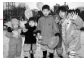
出初め式を見学。寒さなんてへっちゃらさ