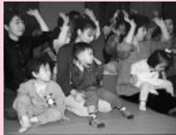
とっても楽しいパンダ広場

10時から各保育所へどうぞ。 土崎保育所 ☎(845)1571 みんなと遊ぼう。2月8日(木) 午前9時30分～11時 川口保育所 ☎(832)4582 お茶会もします。2月15日(木) 午前9時30分～11時