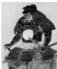
初代藩主・佐竹義宣

戦国時代に常陸50万石余を領有した佐竹氏は、全国の中でも大大名として知られています。天下分け目の戦いとなった関ヶ原の合戦で中立的な立場をとった佐竹氏は、合戦後、石高を減じられて出羽国秋田に転封されることとなりました。秋田の近世は佐竹義宣を初代藩主として迎えたこの時から始まります。