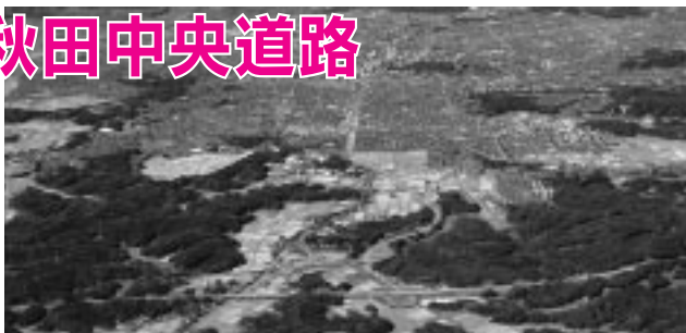
中央インターチェンジから山王方面へスムーズな交通が望まれます