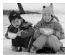
遊んで食べて大満足