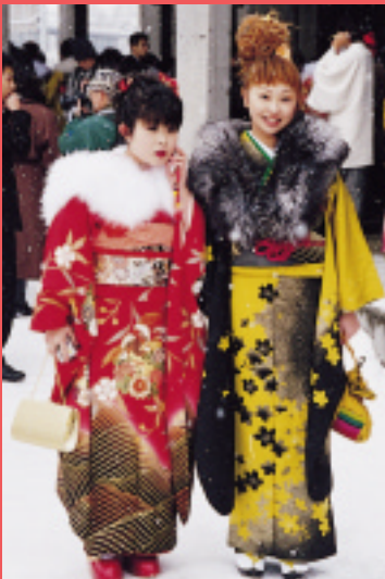
秋田市の成人式は 花まるっ