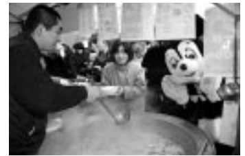
お鍋でほっかほか