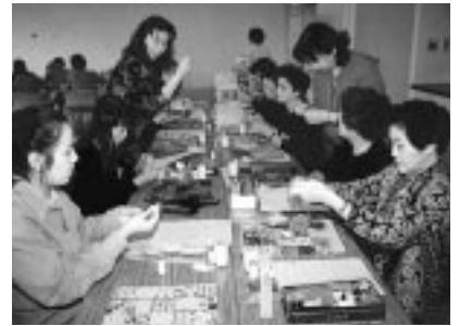
パッチワーク教室