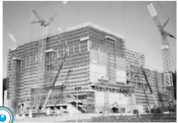
建設中の新しいごみ焼却炉