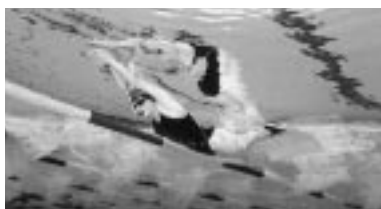
フィンスイミング