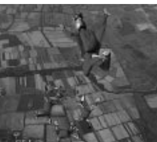
パラシューティング

*日程は、諸事情により変更になる場合がありますのでご了承ください。また、開会式当日は、八橋陸上競技場周辺で交通規制がありますので、ご協力をお願いします。