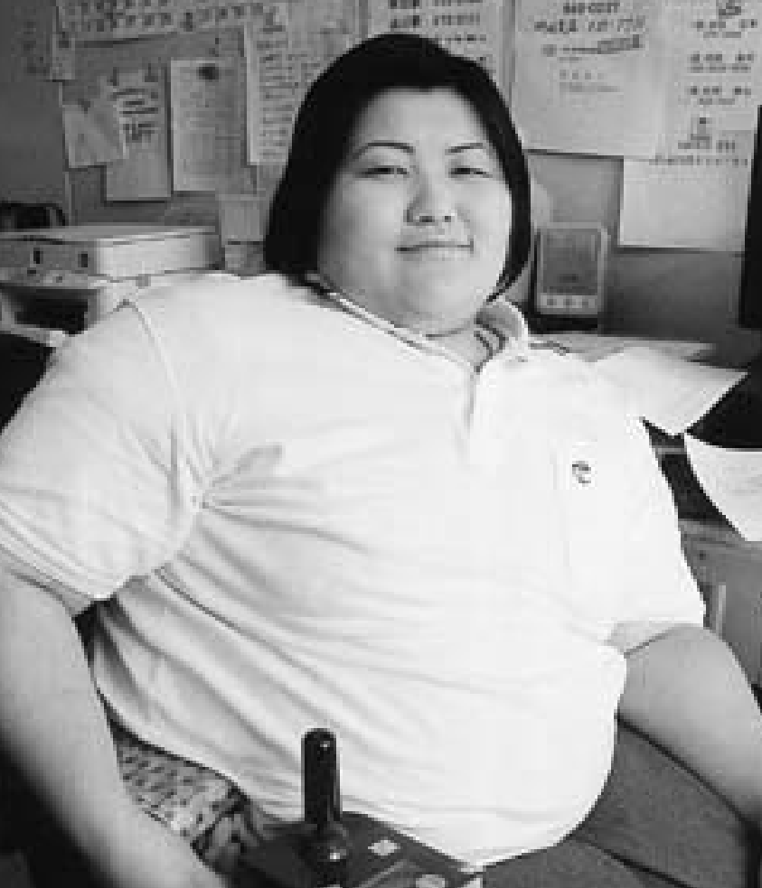
「障害はひとつの個性」と見ることのできる社会にしたいですね