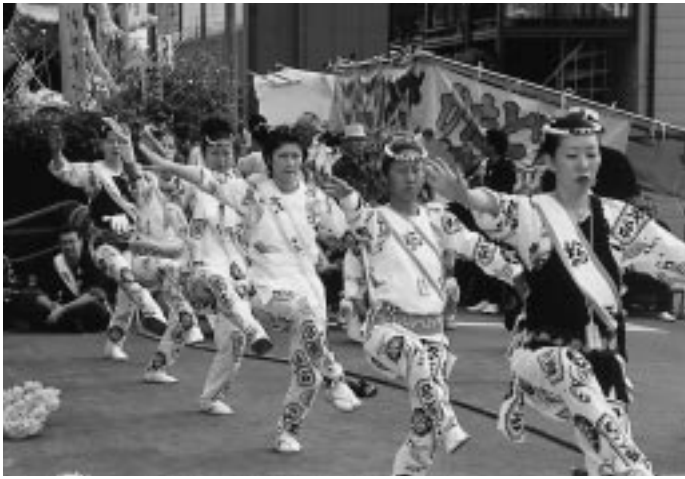
土崎の港曳山祭りで披露される秋田音頭