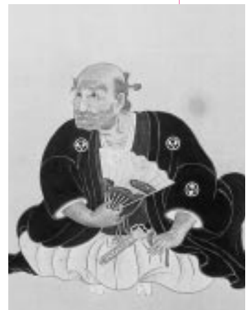
県指定文化財「佐竹侯累代の肖像画」二代佐竹義隆。作者は荻津勝章と推定されている

秋田音頭のルーツに関しては、上方の旅役者が伝えたという説、また外町(町人町)の芝居から生まれたという説など、様々な説・伝承があり、義隆に関する伝承も事実かどうかは、はっ