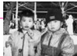
美の国秋田冬まつりで