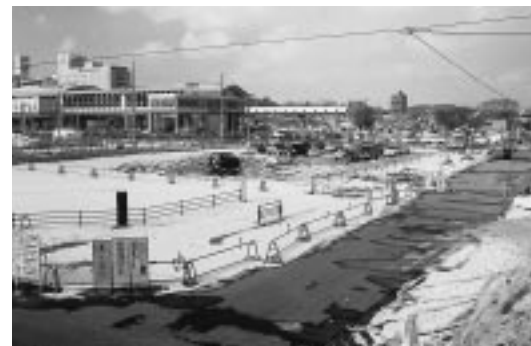
工事中の手形東通線。今年度中に約180メートルの区間が完成し、秋田駅東中央線に接続します

ターミナル、タクシーや自家用車の乗降スペースを確保。隣接地には、駐輪場や公衆トイレなども設けます。現在は、広場周辺の道路整備も行っており、手形東通線の一部は三月中に完成する予定です。