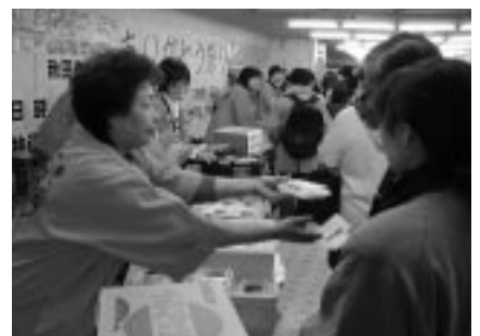
1月26日に行われた市民市場の「ありがとう祭り」。これからもよろしくね！