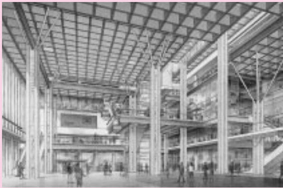
全天候型アトリウムは市民が集う憩いの場に

駅周辺のまちづくりの核として建設します。市民活動の場となる公共施設と多目的広場(アトリウム)、商業・業務施設や福祉施設、ホテル、駐車場が入る民間施設で構成され、にぎわいと楽しさを演出します。民間企業の優れた資本力や経営能力を積極的に活用する施設です。