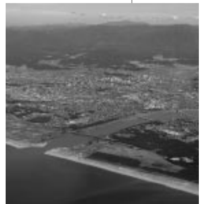
日本海に滔々と注ぐ雄物川

地質学的な調査結果によれば、記録・伝承されているような時代に大幅な流路の変化を裏付けるデータはなく、外旭川に「小菅野の渡し」のような水郷情緒あふれる風景が、本当にあったのか、言い伝えが生み出した幻想なのか、すべては謎です。