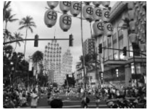
ハワイで行われたホノルルフェスティバルで。立ち上がる竿燈に観客も「Oh,Wonderful！」