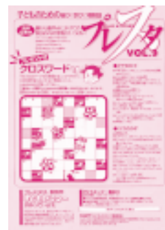
子ども向けの催し物を紹介する「プレスタ」は年3回発行。ホームページでもどうぞ http://www.city.akita.akita.jp/city/ed/ks/

各小学校では、毎月第二・第四土曜日の午前中、体育館を開放し、指導者を配置してスポーツやレクリエーションなどを行います。城南・仁井田・四ツ小屋・御所野・日新・下北手・泉・飯島・港北の各地区では、低学年を対象にジュニアスポーツクラブの活動を行っています。第二・第四土曜日に各学校の体育館で、体協やスポーツ育成会など地域のみなさんの指導により運動遊びをします。