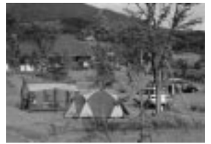
オートキャンプ場

太平山リゾート公園の「テニスの森」「オートキャンプ場」「バンガロー」は、4月27日(土)から営業を再開します。