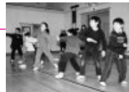
北手のジュニアスポーツクラブ活動で