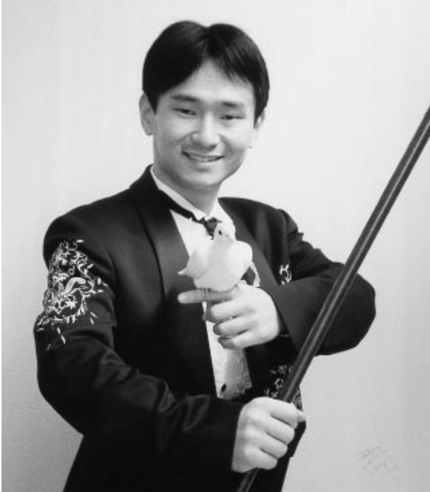
ステージ衣装に身をつつみ、かまえる姿はもうプロのマジシャン！