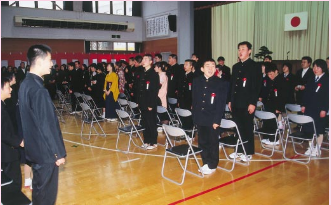
在校生へのメッセージ、「たくさんの思い出つまでも忘れません！」