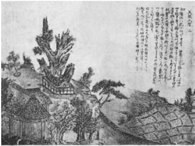
菅江真澄がスケッチした小菅野の渡しの船着き場周辺