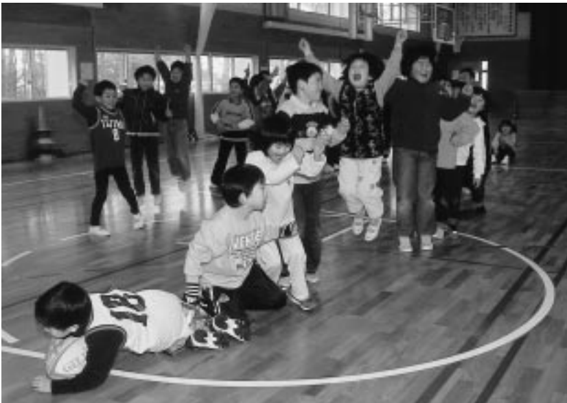
子どものいきいきした表情が印象的(飯島小のジュニアクラブ)

文部科学省が行った「子どもの体験活動等に関するアンケート」によると、生活経験、お手伝い、自然体験が豊富な子どもほど、「道徳観や正義感」が身に付いていることがわかりました。