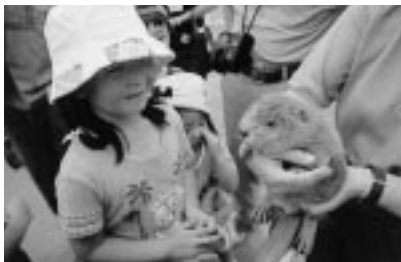
ビーバーの赤ちゃん、かわいいね

大森山動物園は、秋田県でただひとつの動物園。約百二十種類の動物が暮らしています。今から二十九年前の昭和四十八年九月にできましたが、その前は千秋公園の中にあいました。動物園の人たちは、動物たちが安心して生活でき、園に来た人が元気な動物たちに会えるように食事などの世話をしています。病気やケガをしたときに、すぐ治療できる獣医さんもいるので、野生の動物がケガをして運ばれてくることもあります。動物園は、動物たちの大切な命を守る場所でもあるんだね。小・中学生は入園無料です。何度も行けば、動物の気持ちがわかるようになるかも…。