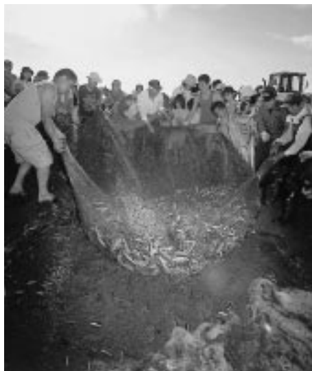
とれたて、ピチピチ!