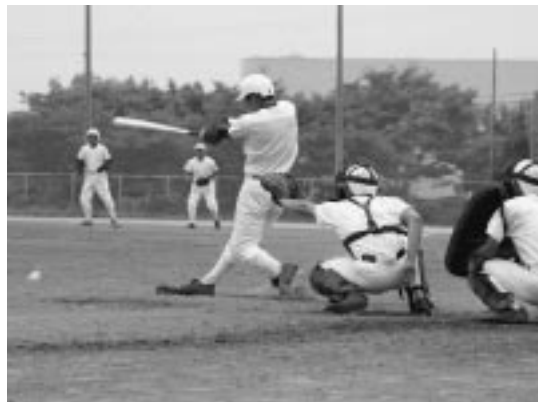
甲子園を前に、練習をかさねる秋商ナイン

別にして、子供の頃から草野球で鍛えられ、大半がグローブを手にしたことのある我々の年代層では、アルプススタンドに響き渡るお馴染みのテーマソングに合わせ入場行進する高校球児の姿に、過ぎ去りし高校時代を重ね合わせ、ほのかな感傷に浸りながら胸を熱くし、言いようもない高揚感に包まれるかたも多いのではないかと思います。