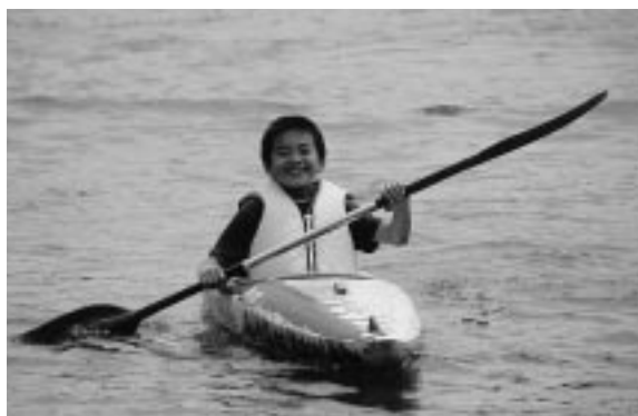
カヌー、ひとりで乗れたよ！