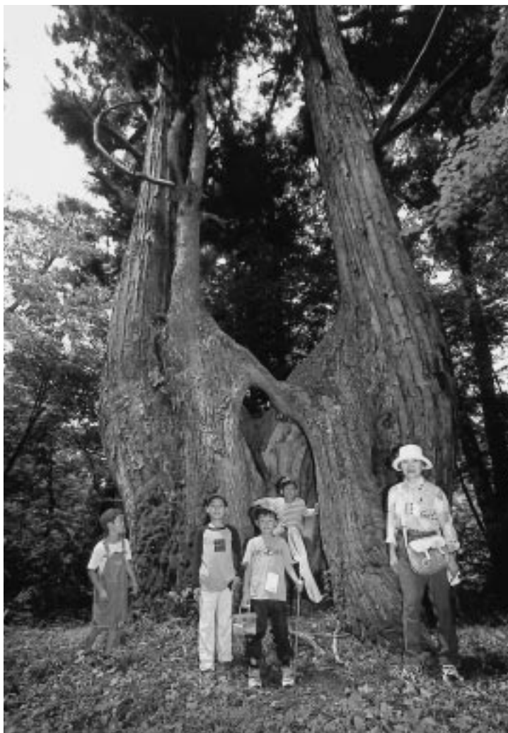
めもと杉から、こんにちわ！