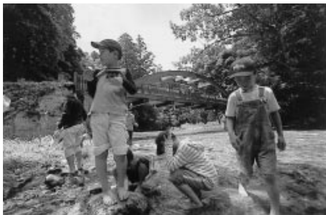
水がきれいだね。あっ、カニがいるよ！