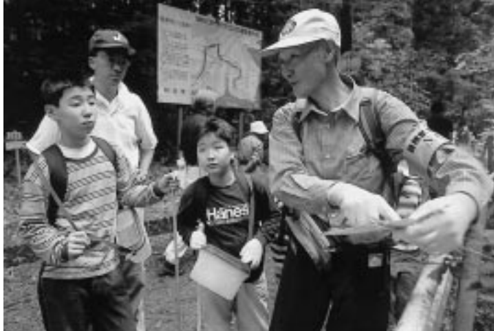
仁別国民の森で自然観察会