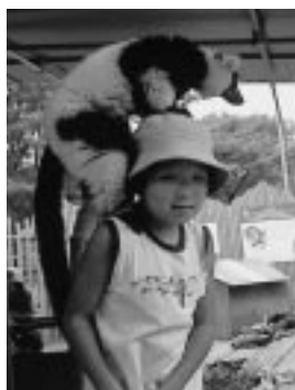
おさるさんとなかよし