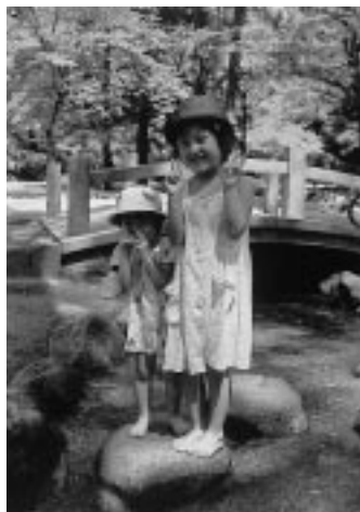
千秋公園の小川で水遊び