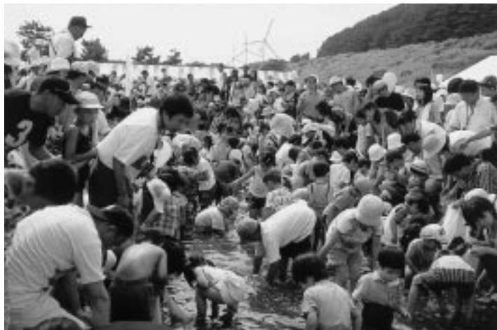
イワナのつかみどりは大盛況！ (雄物川ふれあいまつり)