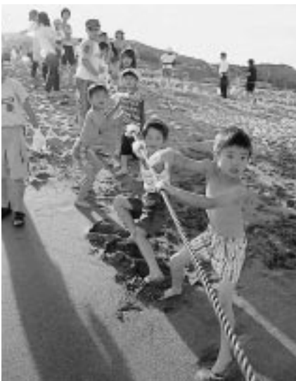
ヨイショ! どんな魚がとれるかな?