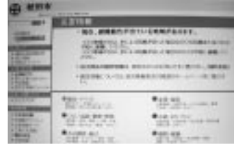
災害時ホームページ画面の例