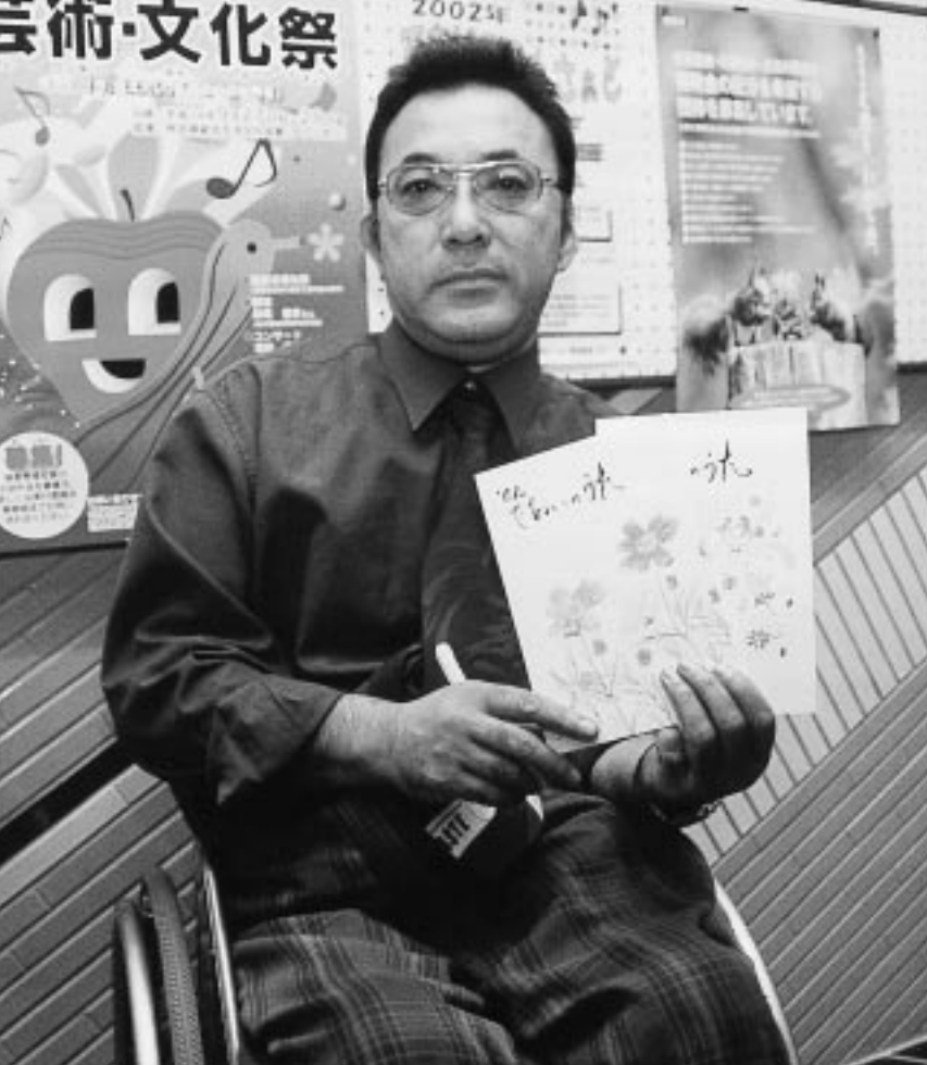
みんなのハートが詰まった詩集です。ぜひコンサートに来てください