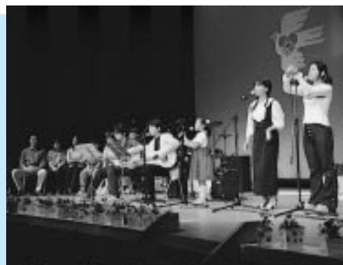
みんなで楽しく歌いましょう