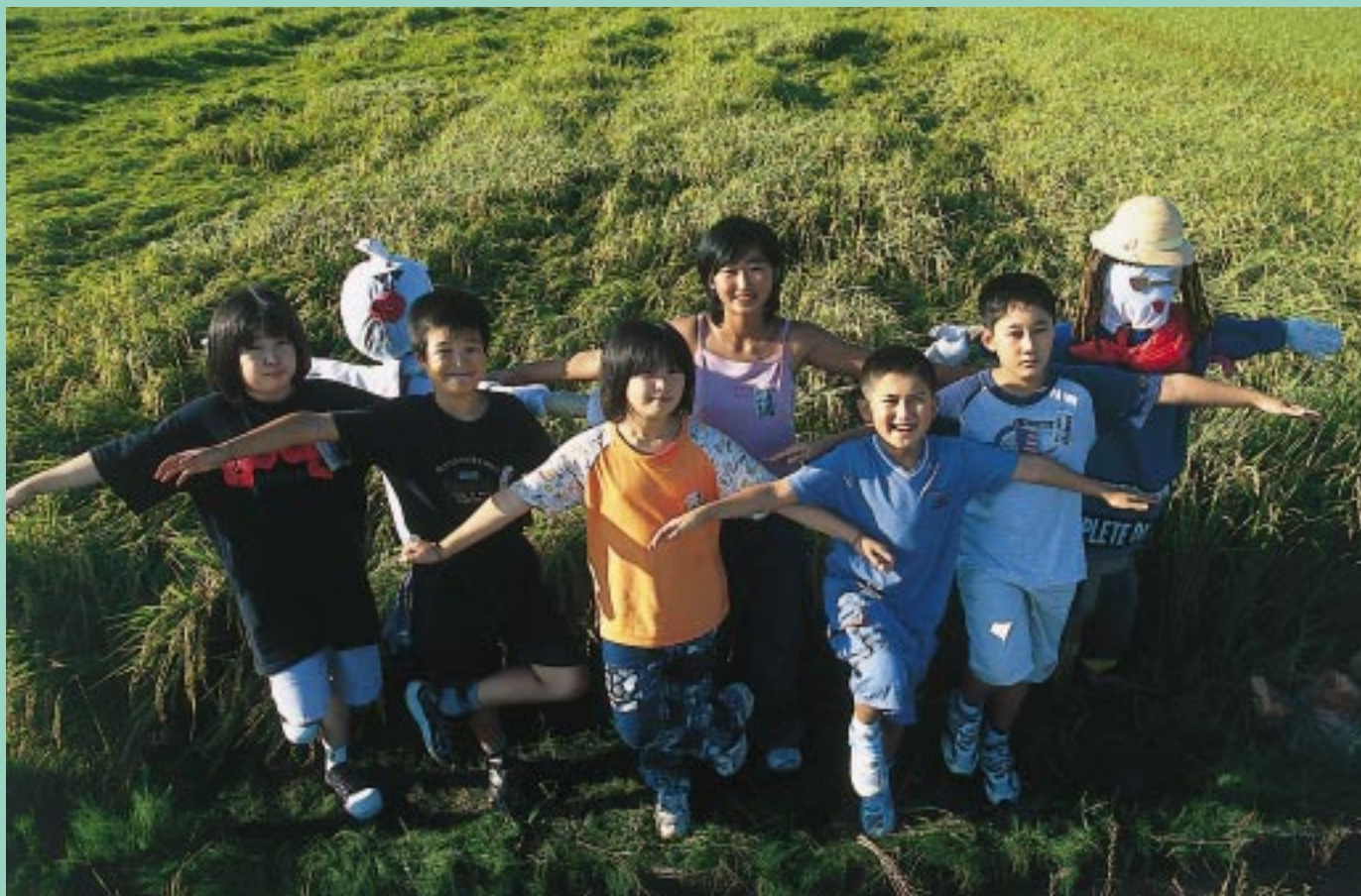
かかしと一緒に、ポーズ！