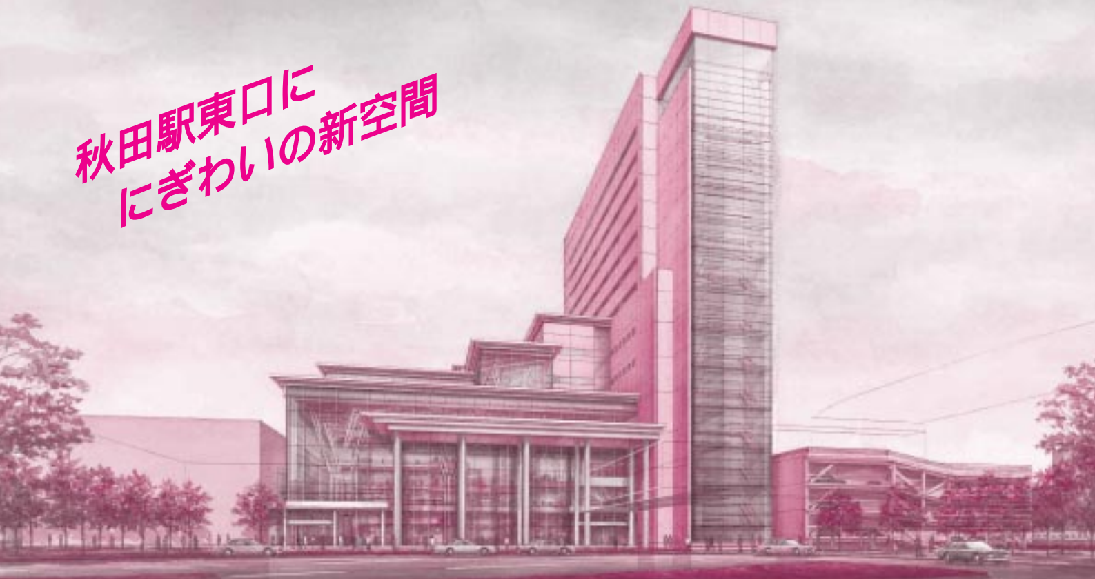
拠点センター完成予想図