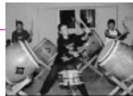
築峰太鼓の練習風景