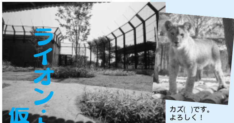
カズ( )です。よろしく!