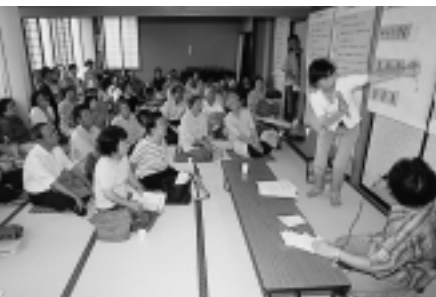
1 明德地区のワークショップ