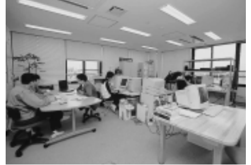
チャレンジオフィスあきた創業支援室内