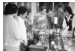
リサイクルプラザ内の見学

町内会や婦人会など各種団体が対象 日程は、9月2日(火)から10月31日(金)まで毎週火・水・金曜日