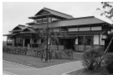
遊学舎にある 昭和館(移築民家)