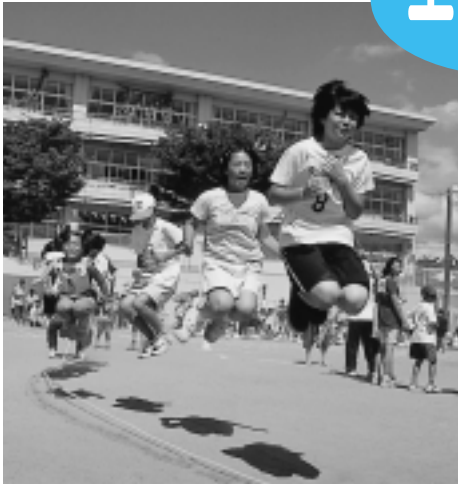
昨年の大会(寺内地区)

第24回「全市一斉スポーツレクリエーション大会」が今年も各地区で開かれます。家族や近所の人をさそって、みんなでさわやかな汗を流しましょう。