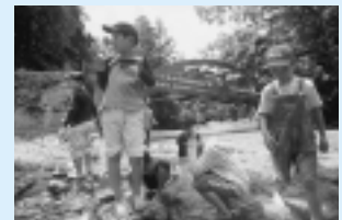
旭川の清流は宝物