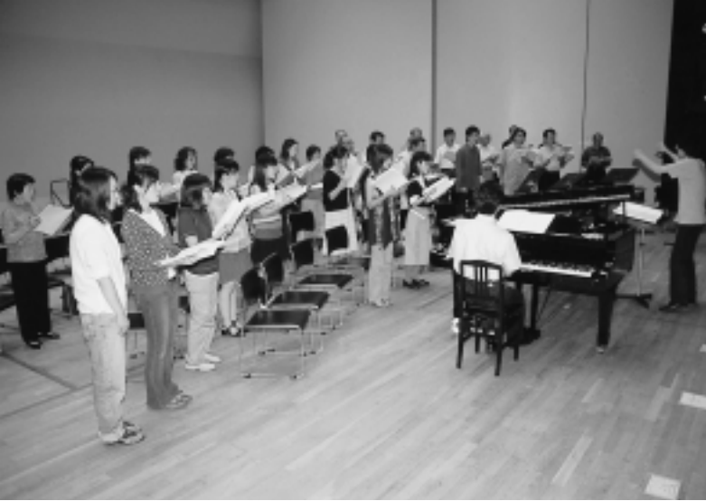
美しい調べがひびき渡るコーラスの練習

秋田市建都四百年を記念し、江戸時代の久保田城下町を舞台にした郷土創作オペラを上演します。市民参加による感動の公演です。ぜひご覧ください。