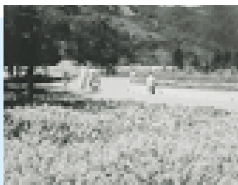
チェックポイントの花公園