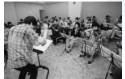
本番さながら。オーケストラの熱い練習