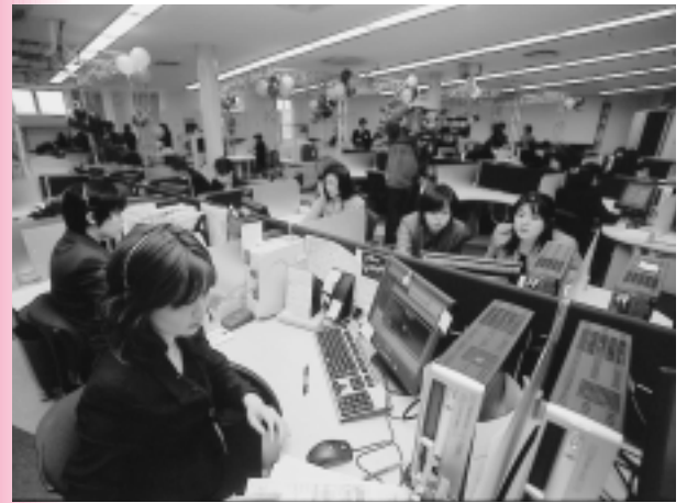
プレステージ社のオペレーションルーム