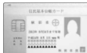
住民基本台帳カードは市民課で発行しています

転出先、転出者などを書いて、転出前に市民課、土崎・新屋支所へ郵送してください。 転出先の市区町村で、住民基本台帳カードを提示してください。