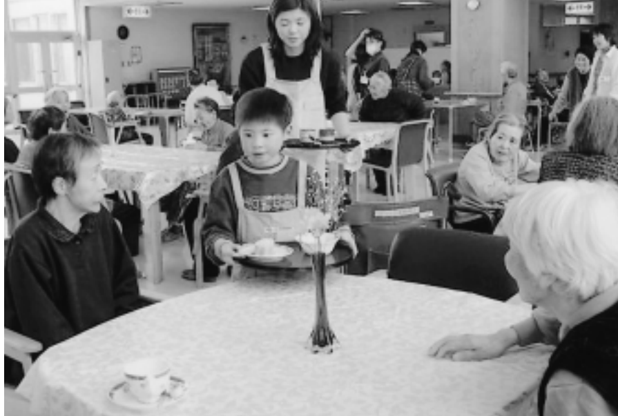
移動喫茶ぼっぼ...地域のボランティアのみなさんが、2か月に1回、医療法人久幸会で喫茶を営業。利用者みなさんに大変喜ばれています