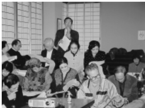
計画づくりのため各地で開催したワークショップ

秋田市地域福祉計画は、特定の人のためではなく、市民一人ひとりのしあわせのために、これからのようなことが大切になっていくのかを、改めて考え直してみました。その結果、五つの基本理念と三つの基本方針のもと、計画書を三章で構成しました。