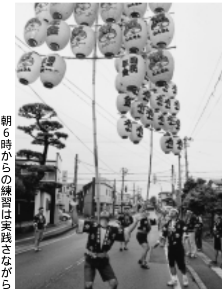
朝6時からの練習は実践しながら

「得意なのは腰と額。技の基本『流し』も徹底的に特訓しています。出場選手は、小さいころ、みんな親父が竿燈を上げる姿を見て育った、いわば「2代目」。気心の知れた5人組で絶対勝ちます！」