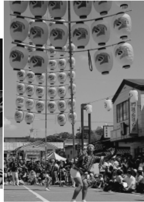
昨年の妙技会、柳町の演技