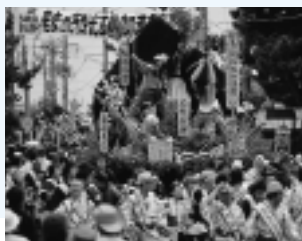
土崎港曳山まつり