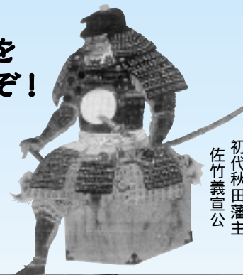
初代秋田藩主 佐竹義宣公