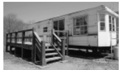
トレーラーハウス