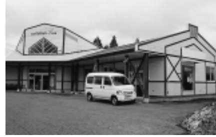
雄和休憩サービス施設

県立中央公園入口付近にある雄和休憩サービス施設は、農産物などの直売所としてご利用いただけます。出店を希望されるかたはお問い合わせください。なお、販売に必要なイスやテーブルなどは各自でご準備いただきます。