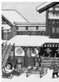
勝平得之「日本の家屋と生活」口絵

観覧料 一般200円 中学生以下無料 「米作四題」などの代表作をはじめ、初期の作品や初公開の関連資料を展示します。郷土の版画家・勝平得之の世界をご堪能ください。 問い合わせ 赤れんが郷土館tel(864)6851