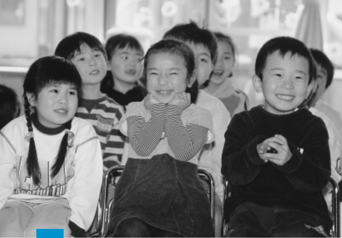
健やかな未来のために...

秋田市ではこの三月、急速に進む少子化に対する集中的・総合的な取り組みとして、「秋田市次世代育成支援行動計画」を策定しました。今年度からこの計画を実施していくにあたり、新たに「男女共生・次世代育成支援室」を設置。今後は、この支援室で市役所各課の事業を調整しながら、子どもたちの未来に夢と希望をもてるまちをめざします。