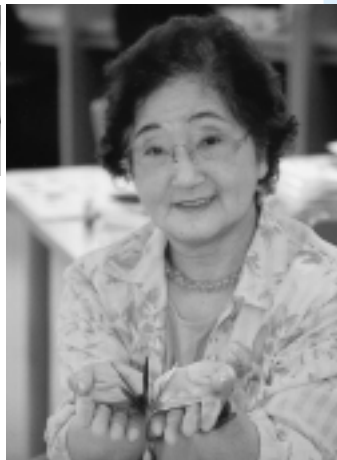
童心にかえりますね