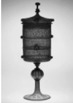
ダイヤモンド彫り 蓋付ゴブレット (ヴェネチア 16世紀後半)