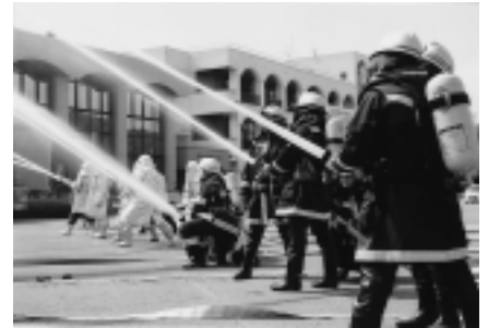
雄和市民センター

合併後初となる秋田市総合防災訓練が雄和地域で行われました。震度6弱の地震による被害を想定した訓練は実践しながら、震災被害を最小限に食い止めるため、一致団結してがんばりました。