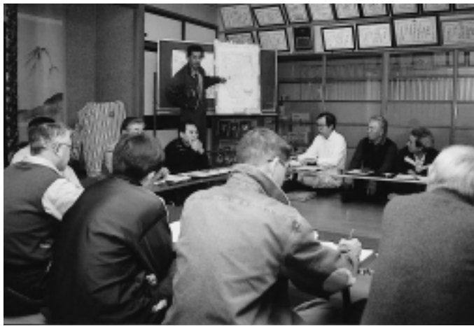
11月26日まで3回、話し合いを行いました(大住)