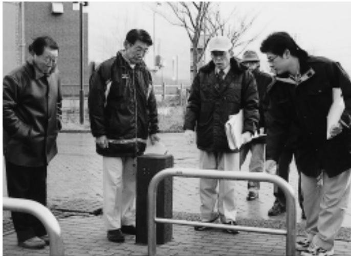
12月2日、除雪の要注意箇所を業者と下見(御所野)

冬期間の安全なまちづくりに、除雪対策は欠かせません。それも、市に頼りっぱなしではなく、みんなで力を出し合うのが大事だと思います。モデル地区に指定されたのがきっかけになって、町内のみんなが除雪に関心を持ってくれたらうれしいです。そこから、暮らしやすいまちを作る気持ちが生まれてくることを期待しています。