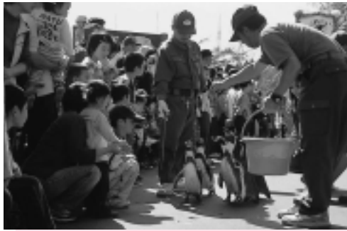
動物ふれあいカーニバル

子どもも大人も一緒になって楽しめる動物園。もっと身近に、笑顔あふれる場所に…。そんな動物園のめざす姿をみんなで考えました。