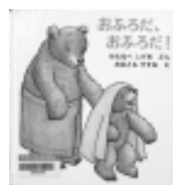
おふるだ、おふるだ！ おおともやすお / え わたなべしげお / ぶん 福音館書店