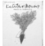
にんじんさんがあかいわけ ひらやまえいぞう/え 松谷みよ子/ぶん 童心社