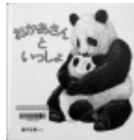
おかあさんといっしょ 藪内正幸 / さく・え 福音館書店