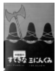
すてきな三にんぐみ トミー=アングラー / さく 偕成社