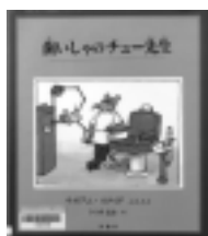
歯いしゃの チュー先生 ウィリアム・スタイク / ぶんとう 評論社