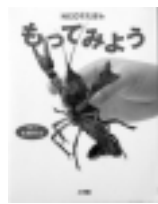
もってみよう 松橋光 / 写真と文 小学館