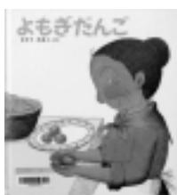
よもぎだんご さとうわきこ / さく 福音館書店