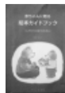
赤ちゃんに贈る絵本ガイドブック 子どもに贈る読書ガイドブック 田中裕子/著 グランママ社