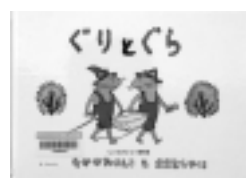
ぐりとぐら おおむらゆりこ / 絵 なががわりえこ / 文 福音館書店