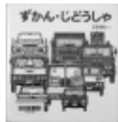
ずかん・じどうしゃ 山本忠敬 / さく 福音館書店

子どもは毎日が発見。自然の中での体験や好きなものとの出会いが、子どものせかいを広げます。自分の目で見、手で触れて感じることを大切にしながら読んであげましょう。