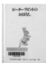
ピーターラビットの おはなし ビートルクス・ポター / さく・え 福音館書店

2、3歳になると簡単なものがたりを楽しむようになり、子どもたちが共感できるおはなしを選びたいものです。想像の翼を広げることができるよう、ゆっくり読んであげましょう。