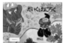
だいくとおにろく 赤羽末吉/画 松居直/再話 福音館書店