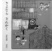
さよなら さんかく 安野光雅 / 著 講談社

絵本を読んであげるひとときは、子どもに語りかけられる、かけがえのない時間です。ゆったりとした気持ちで読んであげてください。おとうさん、おかあさんの声につつまれて、絵本のせかいの楽しさといっしょに、愛されているよこび、しあわせな思いが子どもに広がっていくことでしょう。