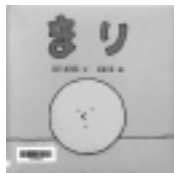
まり 広瀬弦 / 絵 谷川俊太郎 / 文 クレヨンハウス