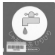
じゃあじゃあ びりびり まついのりこ / 作・絵 偕成社