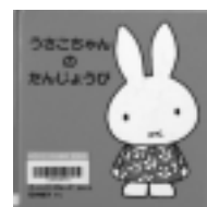
うさこちゃんの たんじょうび ディック・ブルーナ / ぶん・え 福音館書店