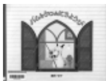
パムとケロの にちょうび 島田ゆか / 作・絵 文芸堂