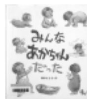
みんなあかちゃん だった 鈴木まもる/作 小峰書店