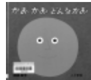
かお かお どんなかお 柳原良平 / 作・絵 こぐま社