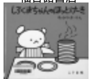
しろくまちゃんの ほっとけーき わかやまけん / 絵 こぐま社