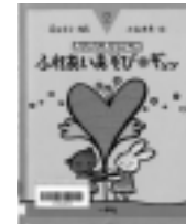
ふれあいあそび ギョッ 藤田浩子/編著 一声社