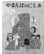
やまはのにしき せがわやすお/え まつたにみよこ/ぶん ポプラ社