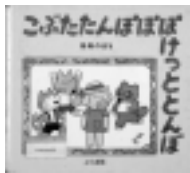
こぶたたんぼぼ ぼけっとんぼ 馬場のぼる / 作 こぐま社

ことばの響きやリズムの面白さ、心地よさが感じられる絵本です。詩を語ったり、わらべうたを唄ったりして楽しみましょう。